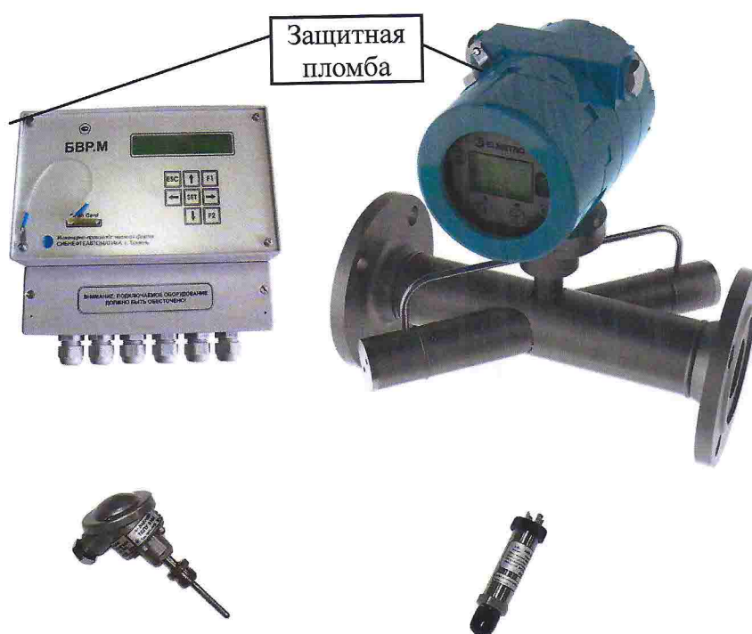
Рисунок 1 — Счётчик газа ультразвуковой СГУ.1

Схема размещения пломб поверителя представлена на рисунках 1 и 2.