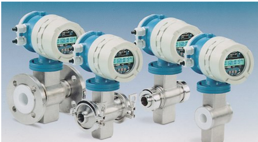
Компактная модель СОРА-XE/XT выполненная с различными типами соединения с трубой: фланцы, хомут TRI-Clamp, пищевое, «сэндвич»

Материал фланцев: углеродистая или нерж. сталь.