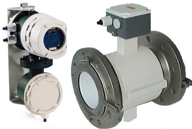
Электромагнитный расходомер MAG-XE: конвертер и первичный преобразователь

Температура окружающей среды: -25... +60 °C